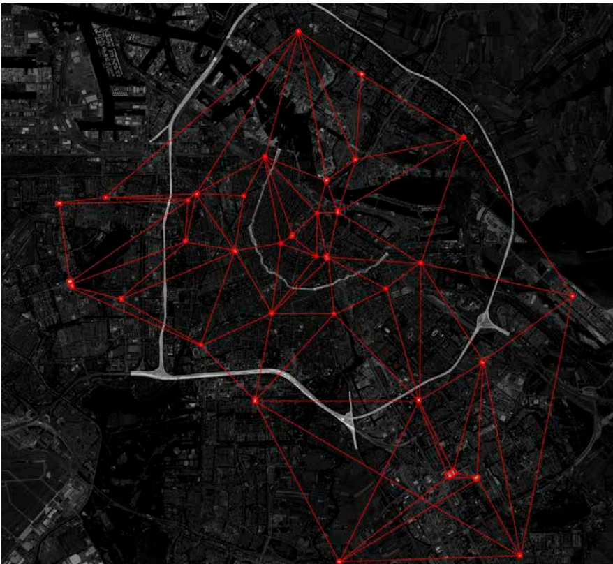
Afbeelding 1. Amsterdam Museum als netwerkmuseum

Amsterdam Museum brengt de geschiedenis van Amsterdam tot leven en geeft inzicht in de identiteit van de stad; het museum daagt bewoners en bezoekers uit hun relatie tot de stad te verdiepen.