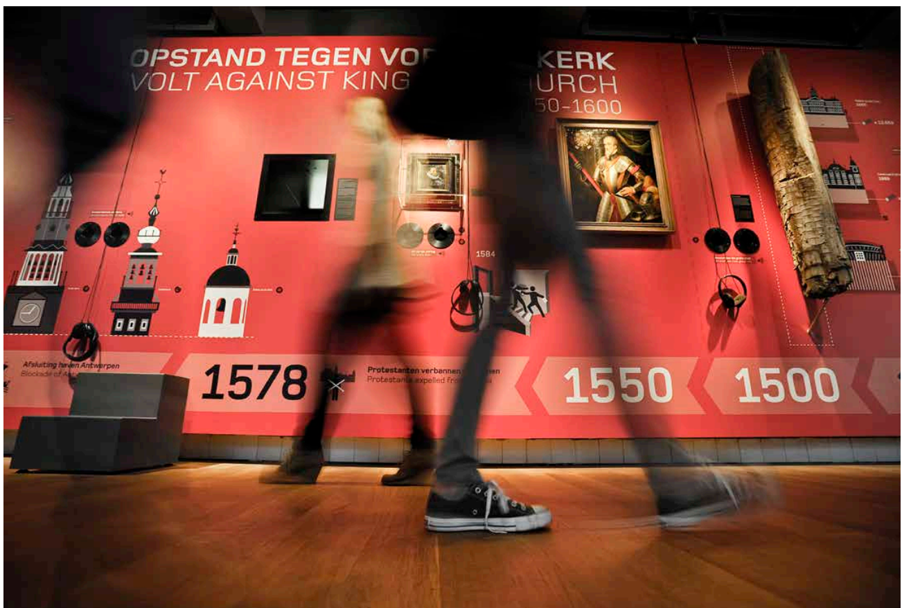
Afbeelding 2. Amsterdam DNA, de huidige permanente tentoonstelling in Amsterdam Museum

In een derde laag bevinden zich de programmeerbare ruimtes: een tijdelijke kleine tentoonstellingsruimte, ruimtes voor Stadsgesprekken (in het kader van de tentoonstellingen van Ontmoet Amsterdam ), lezingen, debatten over actuele thema's of ontmoetingen van groepen uit de stad. Voor zover deze functies grote ruimtes vragen (theater, educatie) bevinden ze zich in een cluster, liefst direct bereikbaar vanuit museumcircuit, zodat debat en participatie 'in' de tentoonstelling steeds voelbaar kunnen zijn.